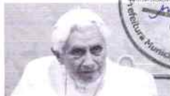
As lés da estreia, o chefe do partido enceta uma reunião na praça votante

Lula África. Avião de viagens à Argentina, Estados Unidos e Chile. O presidente Luiz Inácio Lula da Silva (PT) pretende fazer uma gira pela África ainda no primeiro semestre de 2024, seu mandato prometendo retomar o protagonismo do Brasil no mundo.