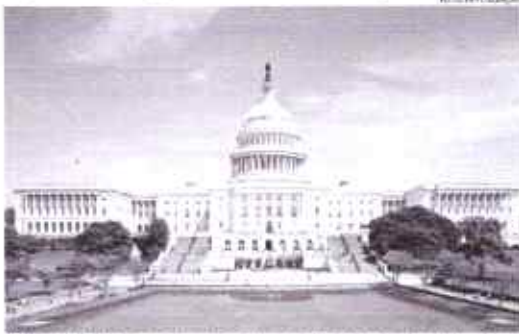
Os deputados terão de votar quantas vezes forem necessárias até que o novo presidente seja escolhido

McCarthy é o atual líder da bancada republicana de deputados, e, por isso, sua vitória era dada como certa meses atrás. Mas o impasse desta terça é resultado direto das mudanças, nas quais separam-se um desempenho muito superior dos membros de sua legenda do que de fato ocorreu. O Partido Republicano tem agora 223 cadeiras em 435 da Câmara, apenas